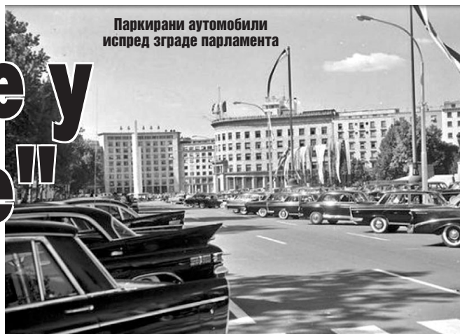
Паркирани аутомобили испред зграде парламента

Београд је једини град у свету који је био домаћин Самита несврстаних три пута 1961, 1989. и приликом обележавања 50-годишњице 2011. године. Уочи оснивачког конгреса 1961. много тога је урађено да би што боље били угошћени државници, углавном из азијских и афричких држава. Заставе земаља чланица су се вијориле у централним улицама, а на дан дочека Теразијама су се испред Савезне скупштине тискали Београђани и машући поздрављали Тита и државнике који су се кретали у аутомобилима без крова. Све припреме су биле поверене чувеном градоначелнику Београда Бранку Пешићу, а забележено је да је уочи самита освануло 40 нових улица и улична расвета, док је Калемегдан добио ноћно осветљење. Реновирано је и око 350 угоститељских објеката и сви хотели, а Теразије и тргови добили су блештаве рекламе. У Пионирском парку, преко пута зграде Скупштине, где се одржавао скуп, никла је Алеја нација са панонама са подацима о земљама учесницама. На ушћу Саве у Дунав у Новом Београду настао је Парк пријатељства, као симбол нераскидиве везе међу народима у покрету. Високи гости су са Титом засадили 28 стабала формирајући Алеју мира, а парк је нова стабла добио и током Девог самита у септембру 1989. године.