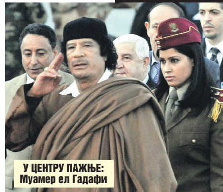
У ЦЕНТРУ ПАЖЊЕ: Муамер ел Гадафи

Расни коњи које је довео Гадафи били су у коњушницама, а он је најавио да ће на конференцију у Центар Сава доћи на белом коњу. Организатори му то нису дозволили, па се возио зеленим кадилаком. Либијски вођа је иначе сваког јутра пио чашу свежег камиљег млека, као еликсир здравља, а када је ненајављено отишао за Триполи оставио је камиле београдском Зоолошком врту и оне су добиле муслиманска имена.