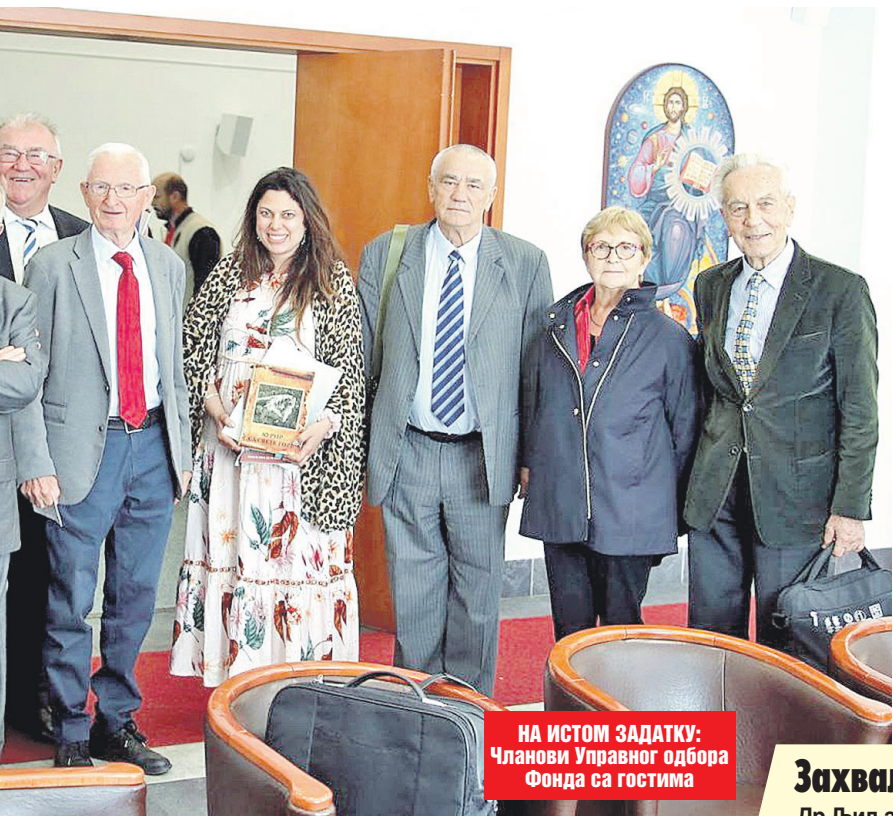
НА ИСТОМ ЗАДАТКУ: Чланови Управног одбора Фонда са гостима