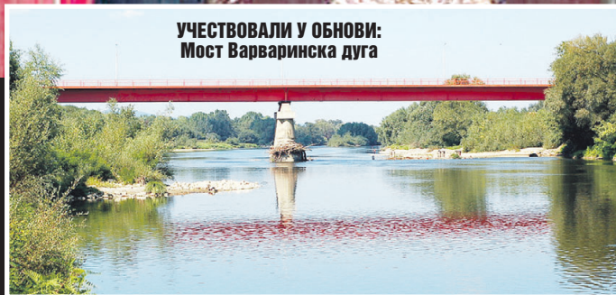
УЧЕСТВОВАЛИ У ОБНОВИ: Мост Варваринска дуга

јевца, али и Фонду за дошколовање младих пољопривредника "Борка Вучић", у новчаном износу од хиљаду евра по кориснику. Такође, активирали смо поново Фондацију "Сања Маринковић" која је досад стипендирала више од 50 студената, талената из математике и техничких наука. На Скупштини је поносно о томе говорио наш штићеник који је на Кембриџу завршио докторске студије, а потом се вратио у Србију како би својим зна-