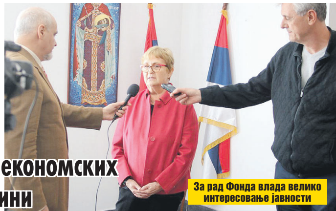
За рад Фонда влада велико интересовање јавности

- Челници НАТО-а и даље воде рат против наше земље. То је структурални рат у коме се они не устручавају да се отворено мешају у унутрашњу политику наше земље кроз разне врсте притисака: од оних директних до индиректних посредством зависних невладиних организација. Од почетка није тајна да Америчка агенција за међународни развој (УСАИД) финансира у Србији оне НВО које раде на промени политичке и државотворне свести Срба, на разарању српских националних осећања и интереса српског на-