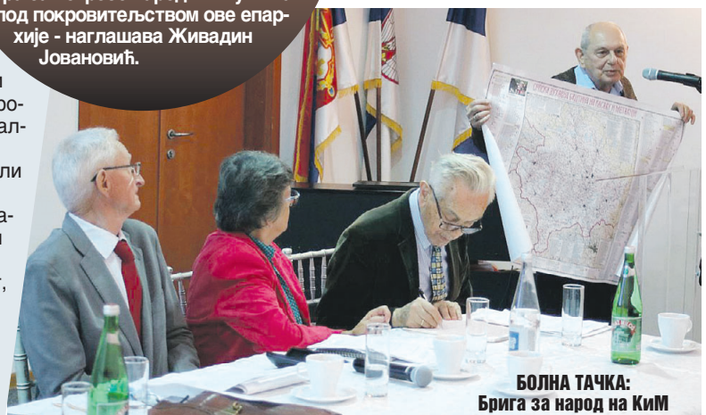
БОЛНА ТАЧКА: Брига за народ на КиМ

- Србија има пуно разлога да буде поносна и на ту чињеницу. То је новац који се слива у девизни биланс Србије због чега јачају валутне резерве, али и међународна финансијска стабилност наше земље. Овај износ превазилази