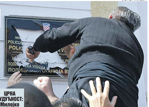
У Вуковару разбијају таблу на ћирилици

У БЕЧУ ИЗЛОЖБА О ЈЕДНОМ ОД НАЈВИЂЕНИЈИХ СРБА ДРУГЕ ПОЛОВИНЕ 19. ВЕКА