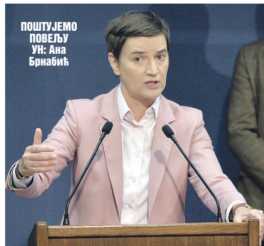
ПОШТУЈЕМО ПОВЕЉУ УН: Ана Брнабић

- Ми смо апсолутно на правој страни историје! Ми смо једна од ретких земаља на свету које неселективно поштују и примењују принципе међународног права, као и повељу УН. Постоје неке ствари које су црвене линије. Те црвене линије су принципи међународног права - нагласила је Ана Брнабић.