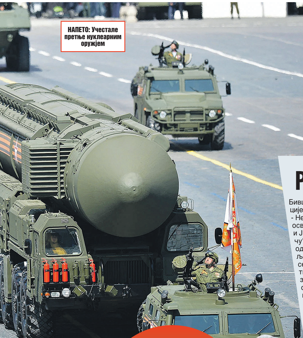
НАПЕТО: Учестале претње нуклеарним оружјем