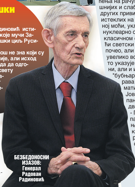
БЕЗБЕДНОСНИ ИЗАЗОВ: Генерал Радован Радиновић